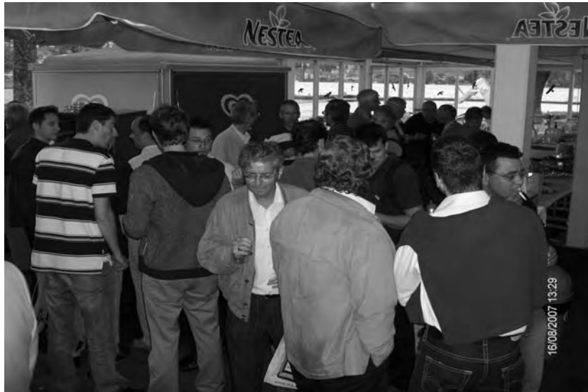
Stelldichein zum zweiten Apéro im Strandbad Nidau. Bier aus dem Lago Lodge vermag die bereits durch die Busfahrt ausgetrockneten Kehlen und Commercianer wiederum zu stärken.