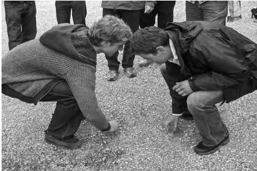
Das Halbfinale nimmt seinen Lauf zwischen dem zweifachen ehemaligen Maibowlenkönig Falco und Virus.