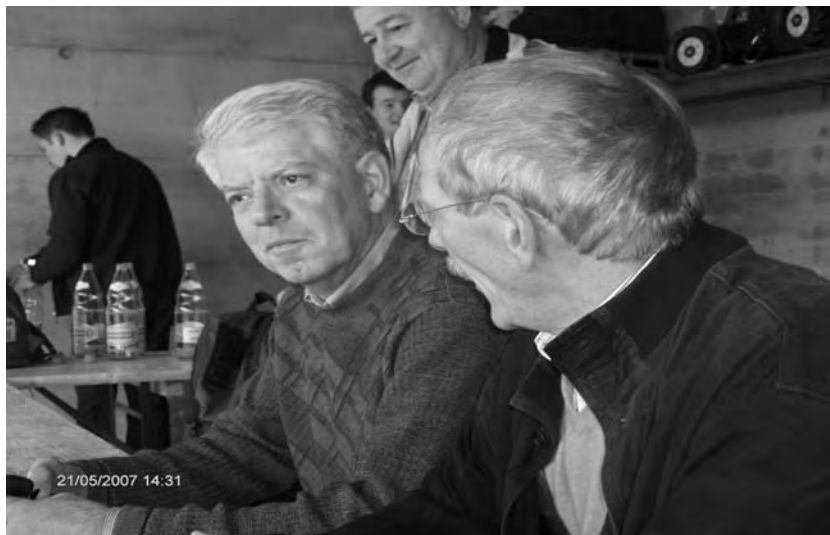
«Hier sind wir versammelt zu löblichem tun...»: Mao, Disco und Force warten auf die Maibowle.