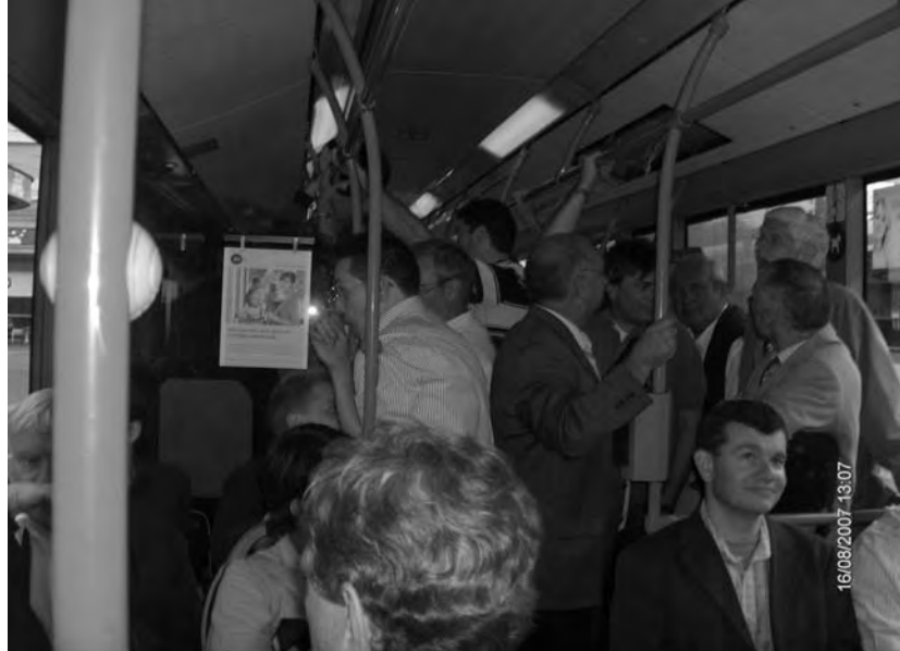
Unterwegs mit dem eigens gecharterten Bus von Biel nach Nidau zum Strandbad