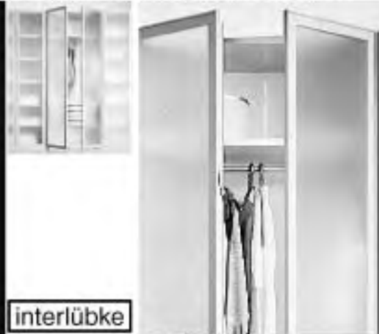
Schranksystem SL von Rolf Heide

Das mobilarte-Team freut sich auf Ihren Besuch!