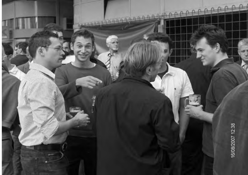
Die Aktivitas in angeregter Diskussion mit Moby.