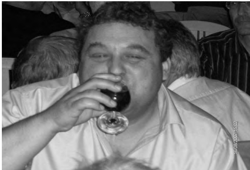
Das Altherrenpräsidium Fis ist sichtlich erfreut über den Erfolg des 90. stiftungsfest und leert daher gleich ein ganzes Glas Wein.