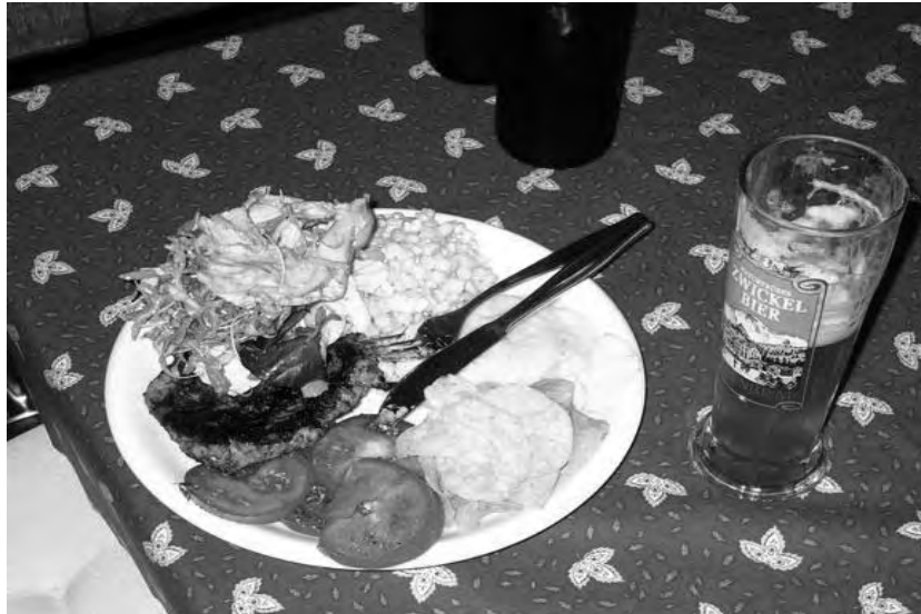
Währschafte Grillade, köstlich mundenende Salate und selbst gebrautes, naturtrübes Bier: Was beehrt der Commercianer noch mehr?