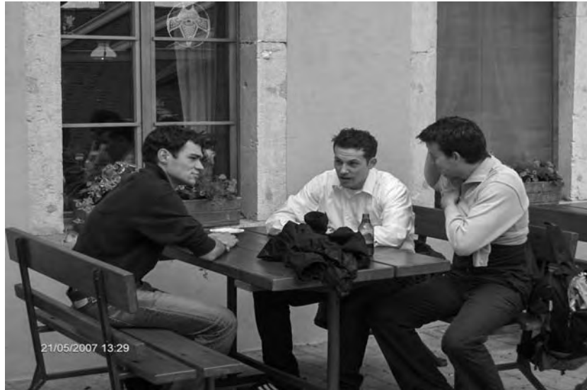
Nach dem Marsch von Magglingen nach Gaicht lässt sich die Wanderschaft traditionsgemäss im Garten des Restaurants Tanne nieder um bei Bier und Wein für die Maibowle zu «bödelen».