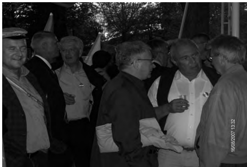
Ein Stiftungsfest immer ein willkommener Anlass für die Altherren, alte Erinnerungen aufzufrischen.