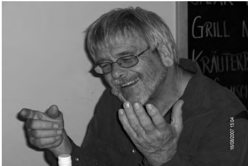
Swim in ausgelassener Stimmung.