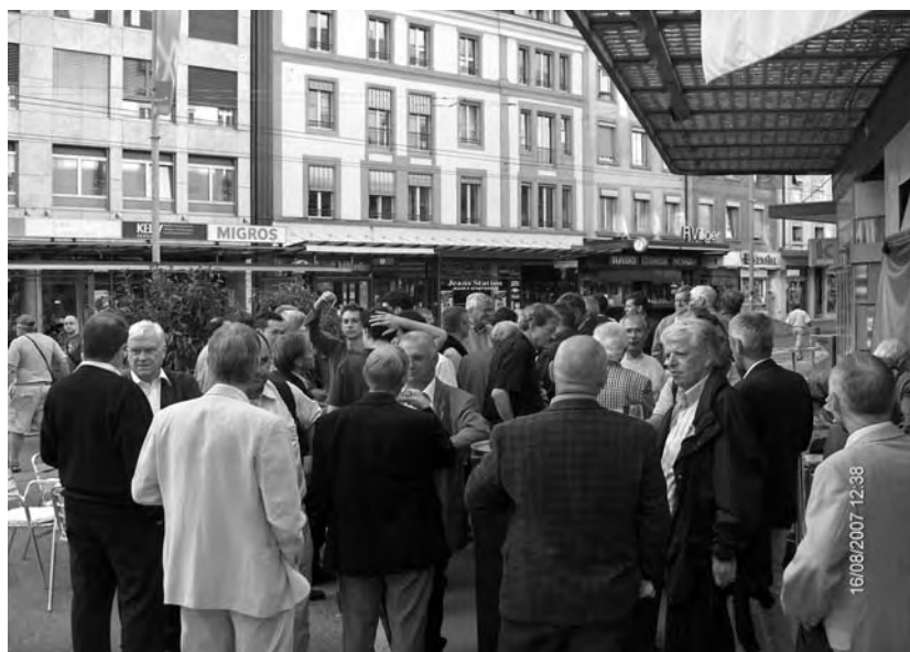
Commercianer, soweit das Auge reicht. Das 90. Stiftungsfest verzeichnete sechzig Teilnehmende!