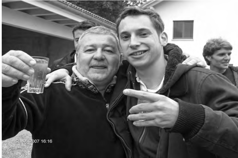
Disco und Astro animieren sich gegenseitig zum Titel des Maibowlenkönigs - Prosit!