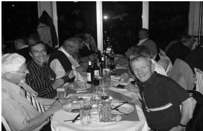
Säbu, Spleen und Force spiegeln den Erfolg des Anlasses wider: «Mir wöi no lang nid hei go, wüu dr Aias ds Stiefeli no nid lo schtärbe het...»