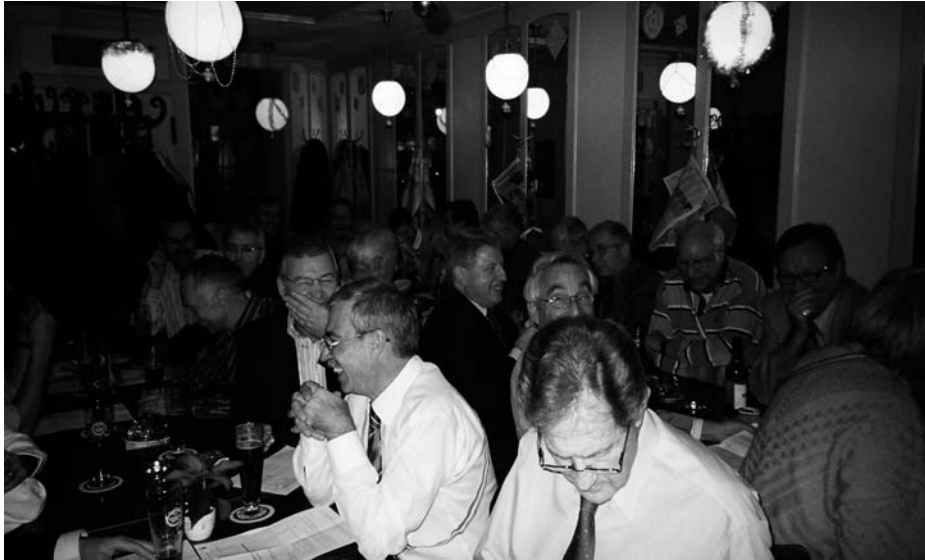
Entspannte Diskussionen der Altherrenschaft anlässlich der Durchführung der Generalversammlung im Restaurant Pfauen. Ribaga v/o Disco ist bereits in den Seilen (Gähn!).