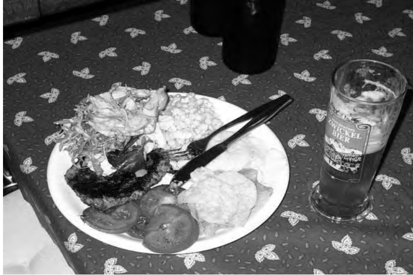
Währschafte Grillade, köstlich mundenende Salate und selbst gebrautes, naturtrübes Bier: Was beehrt der Commercianer noch mehr?