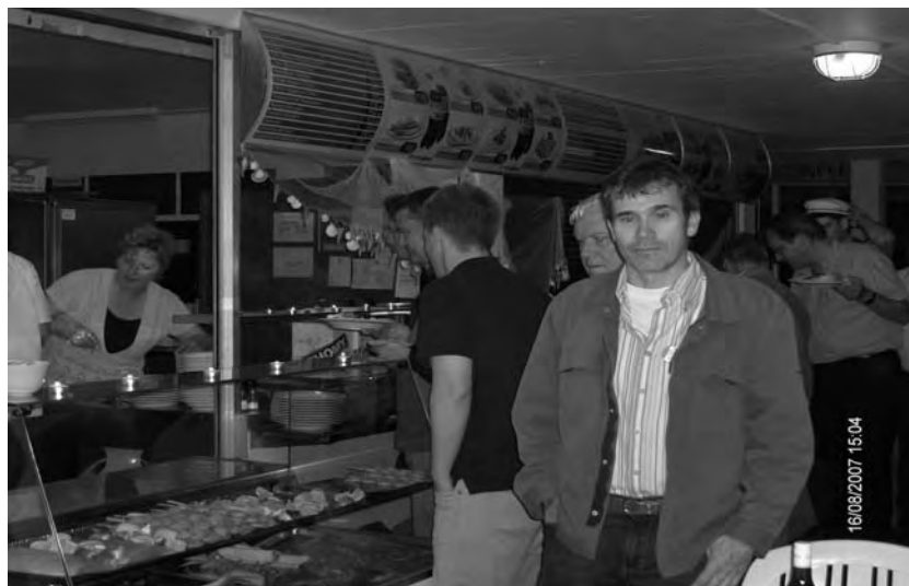
Ein hungriger Zico präsentiert dem Fotografen das Buffet., derweil die Aktivitas die zahlreichen Crevetten in der Auslage zählt.